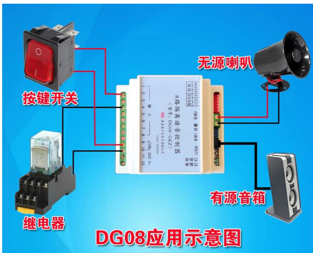
图 1 播放器整体图