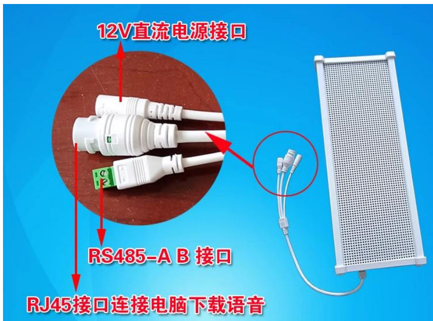
图 2 连接线示意图