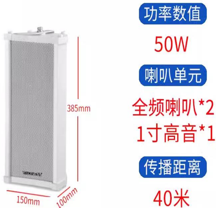
图 1 播放器整体图